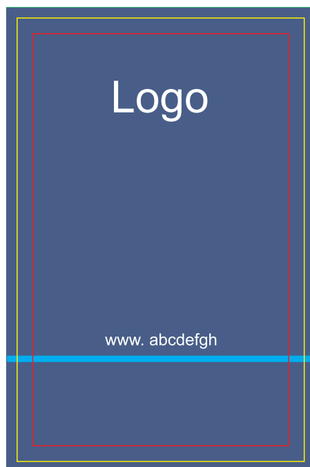
Przygotowanie projektu karta 1 strona